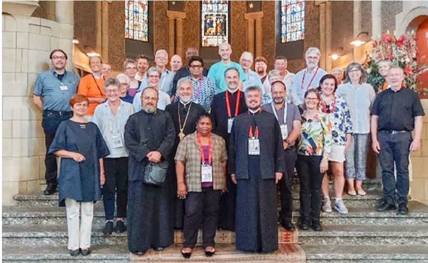
Eine von zwei Delegationen

Mit dem Ende der 11. Vollversammlung des Ökumenischen Weltkirchenrats vom 31.8. bis 8.9.22 in Karlsruhe lautet auch in den Kirchen Baden-Badens das Fazit: die Begegnungen mit Delegierten aus der ganzen Welt am 3. und 4. September waren bereichernd und überstiegen in vielem die Erwartungen.