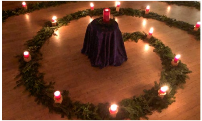
Montag, 28.11.2022, 20 Uhr Gemeindesaal St. Bonifatius