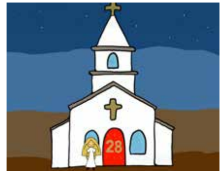
Der Digitale Adventskalender online auf Youtube.com