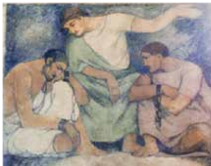
Den Gefangenen besuchen

Der wuchtige Bau der Kirche ist geprägt vom Jugendstil. So wuchtig sie von außen wirkt, so detailliert ist ihr Inneres. In warmen Tönen gehalten, ist sie voller schöner Elemente des Jugendstils. Es ist unmöglich, hier auf alle einzugehen. Befassen wir uns mit den sechs großen Wandgemälden, die rechts und links an den Wänden des Kirchschiffs zu sehen sind.