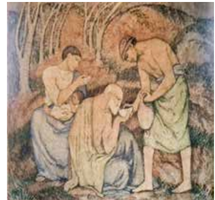
Den Durstigen tränken