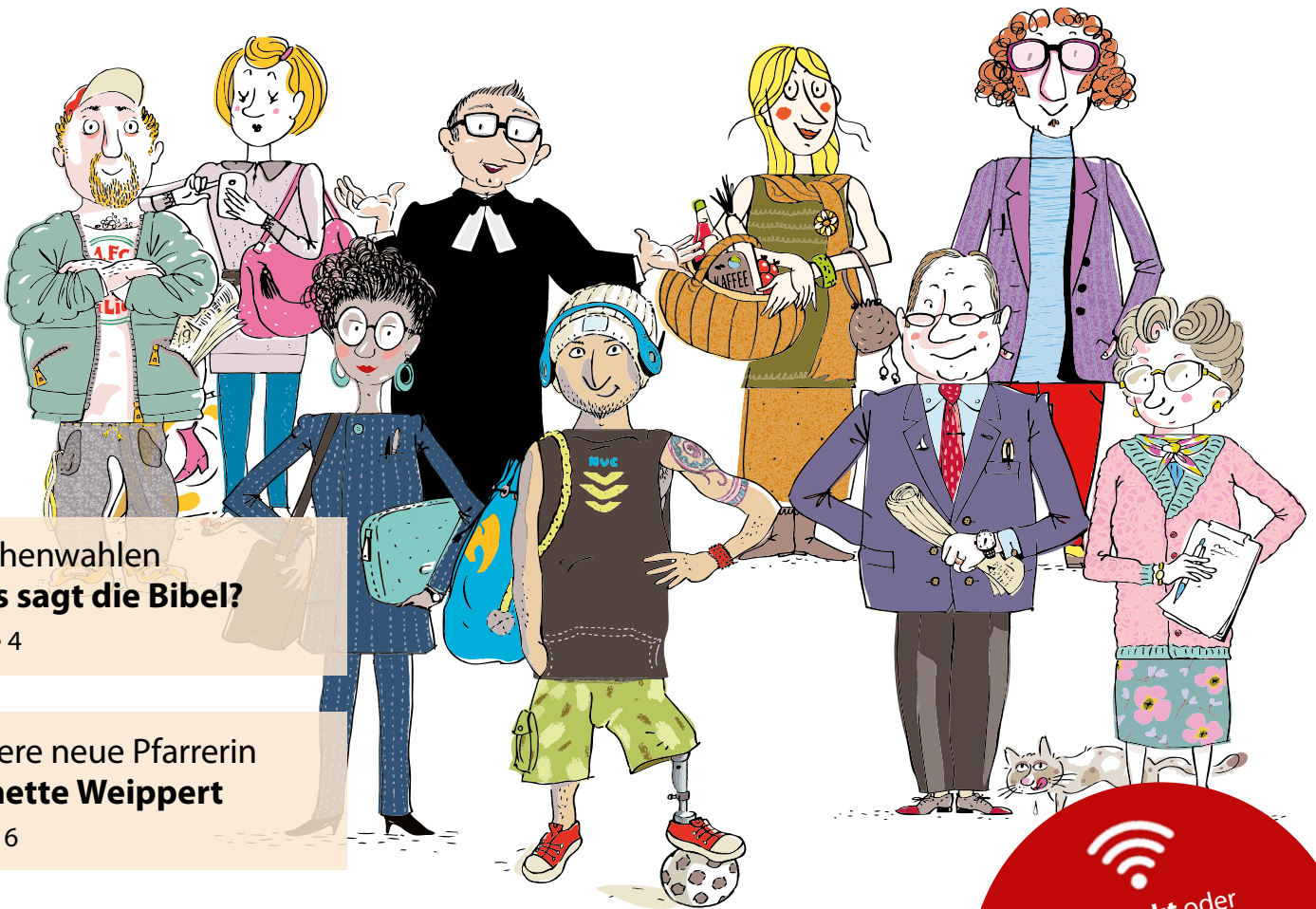
Illustration: Uwe Mayer