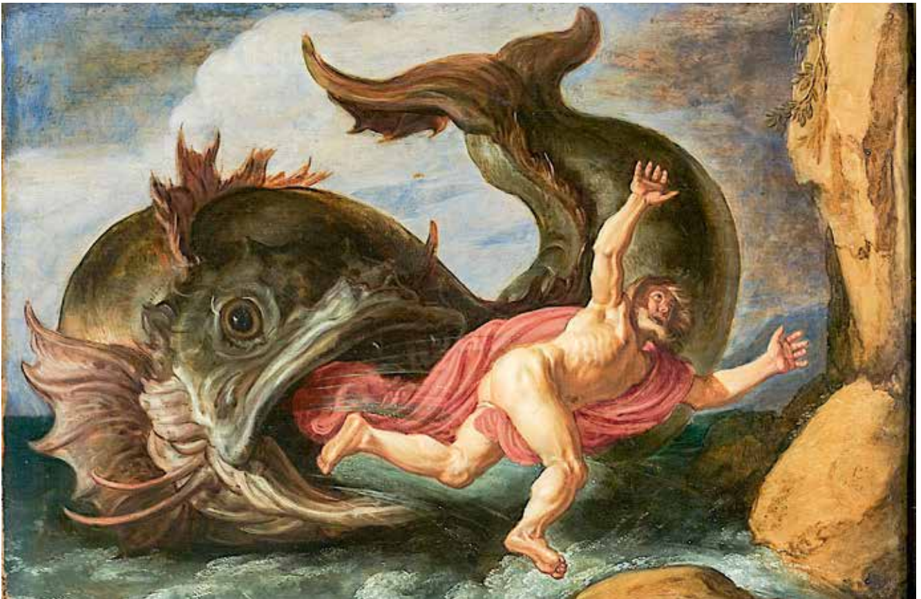
Bild: Jona und der Wal, Gemälde von Pieter Lastman, 1621

Gott wählte Jona als Propheten, er sollte der Stadt Ninive den Untergang vorhersagen. Anders als unsere Kirchenältesten, hatte Jona keine Wahl, er musste sich seinem Schicksal fügen – am Ende bewahrte er die Stadt vor dem Untergang. (Jona 1,1)